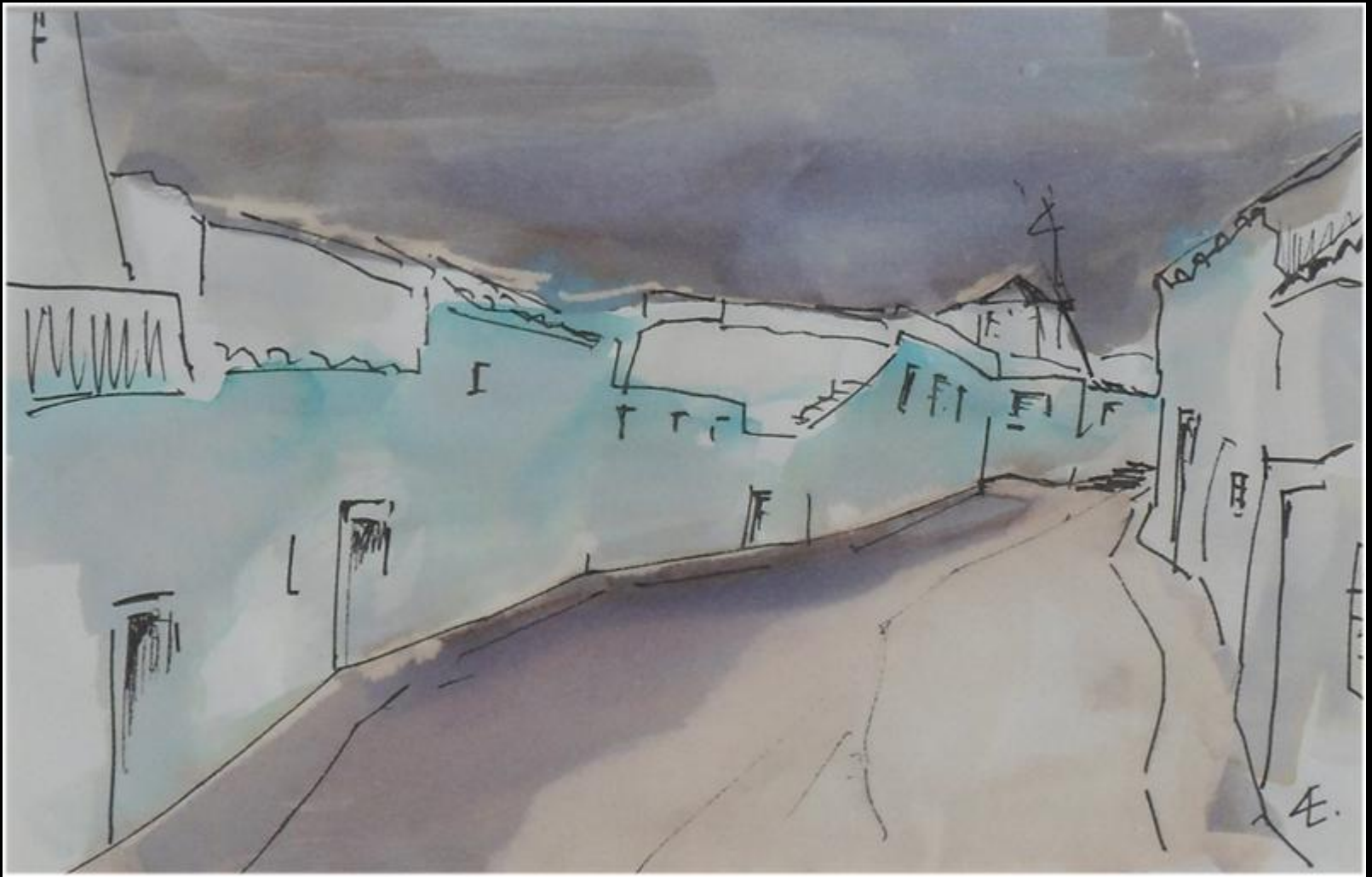
ANDRES ESCRIBANO "Criptana"