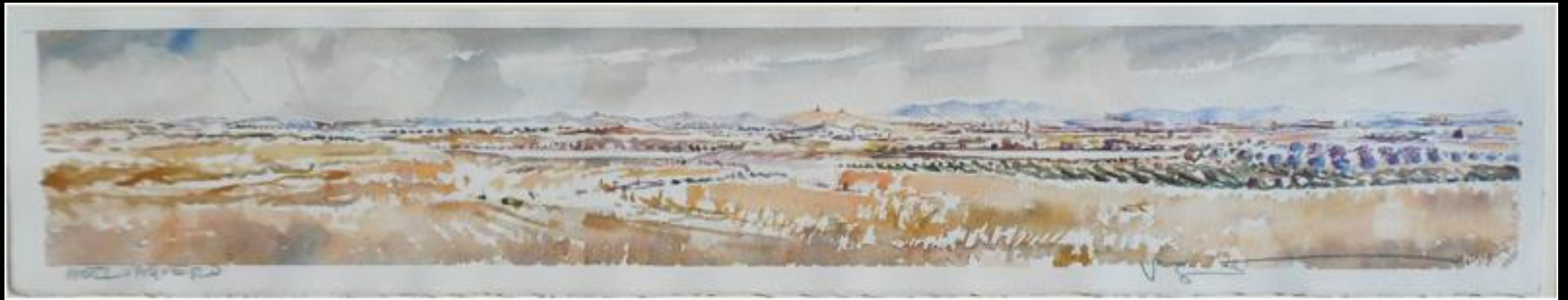
ANGEL VAQUERO "Paisaje"