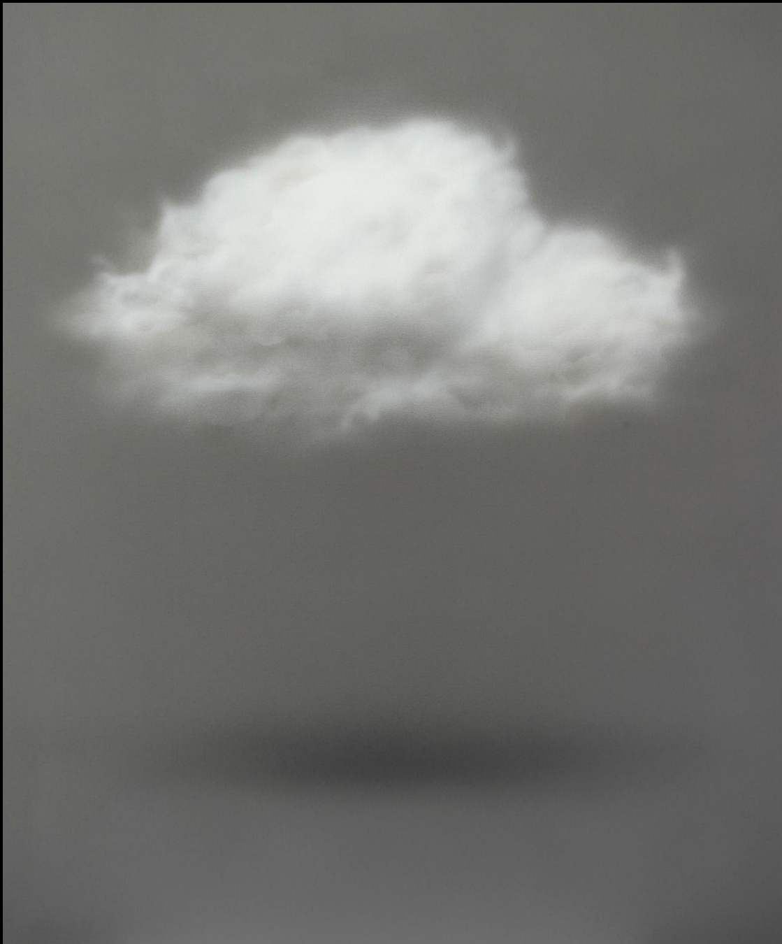
TERUHIRO ANDO "NUBE18FE14"