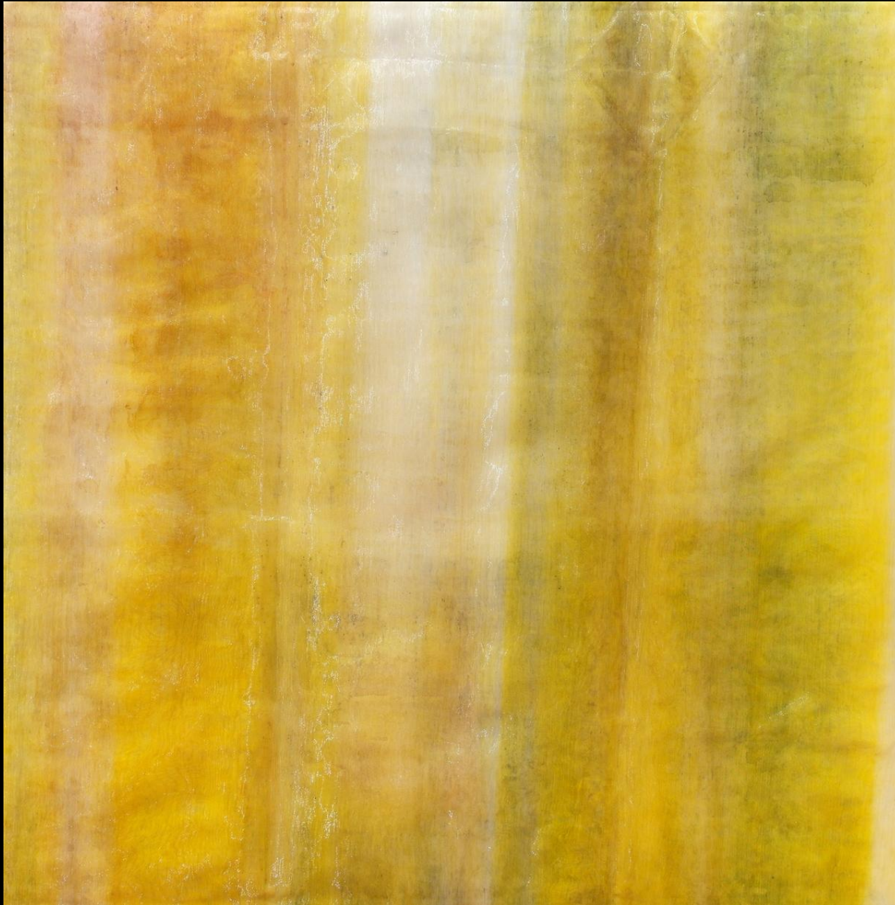
Arminda Lafuente "Serie Y nº 6 Y"