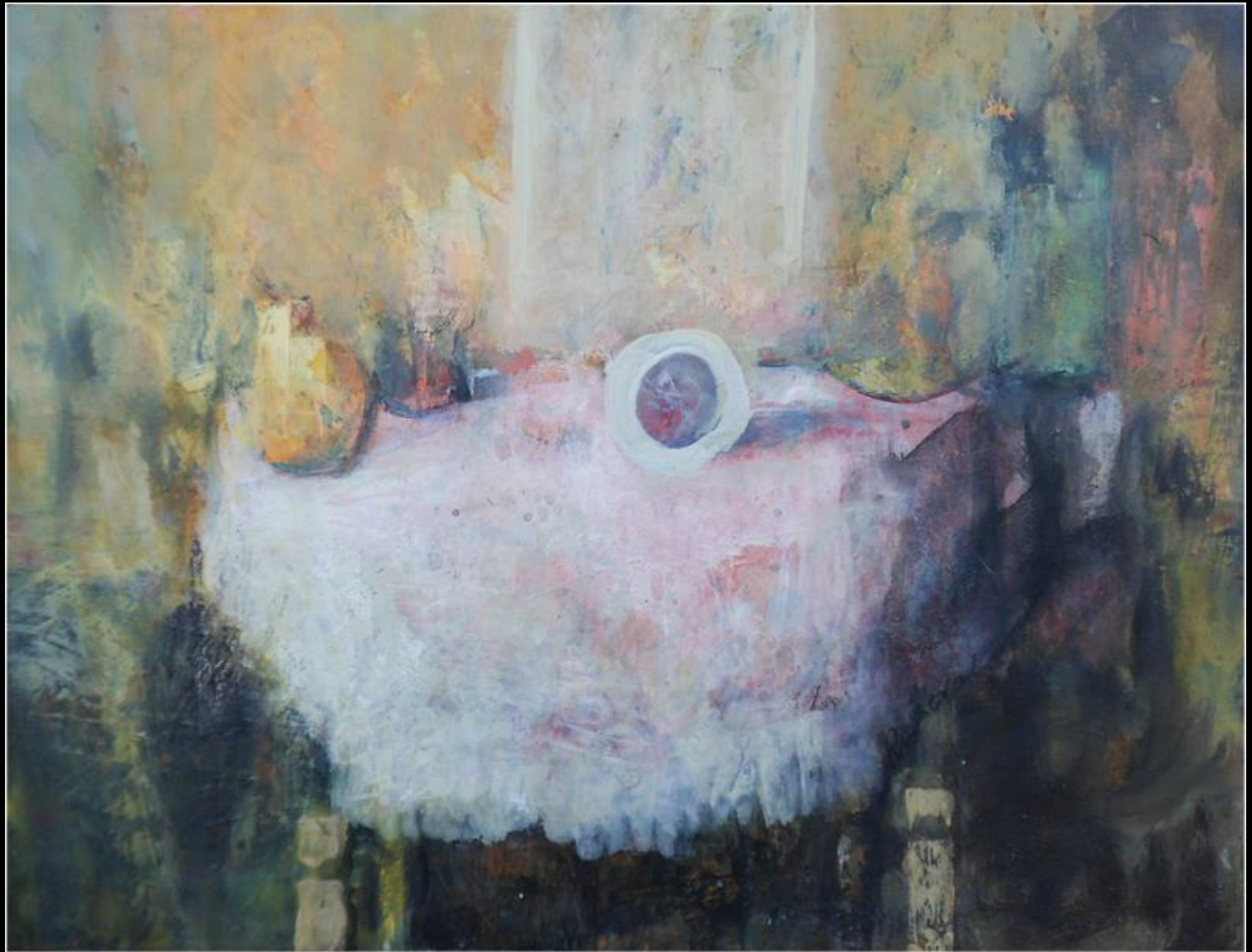
ROMERAL "Bodegón pera"