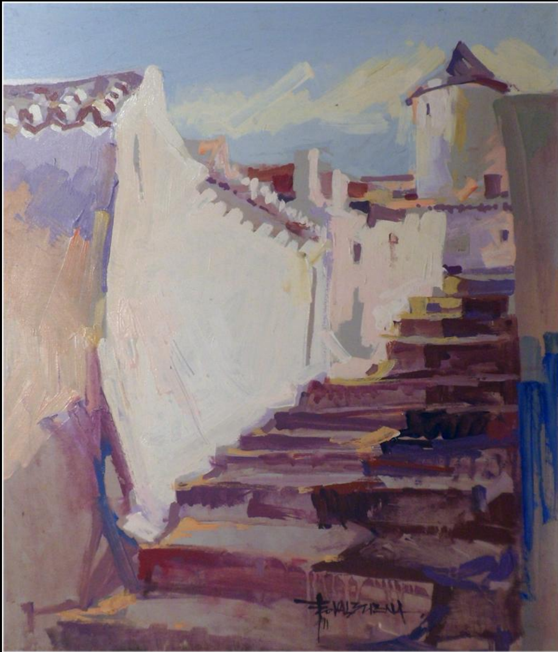
FRANCISCO VALBUENA "Escaleras del Cerro de la Paz"