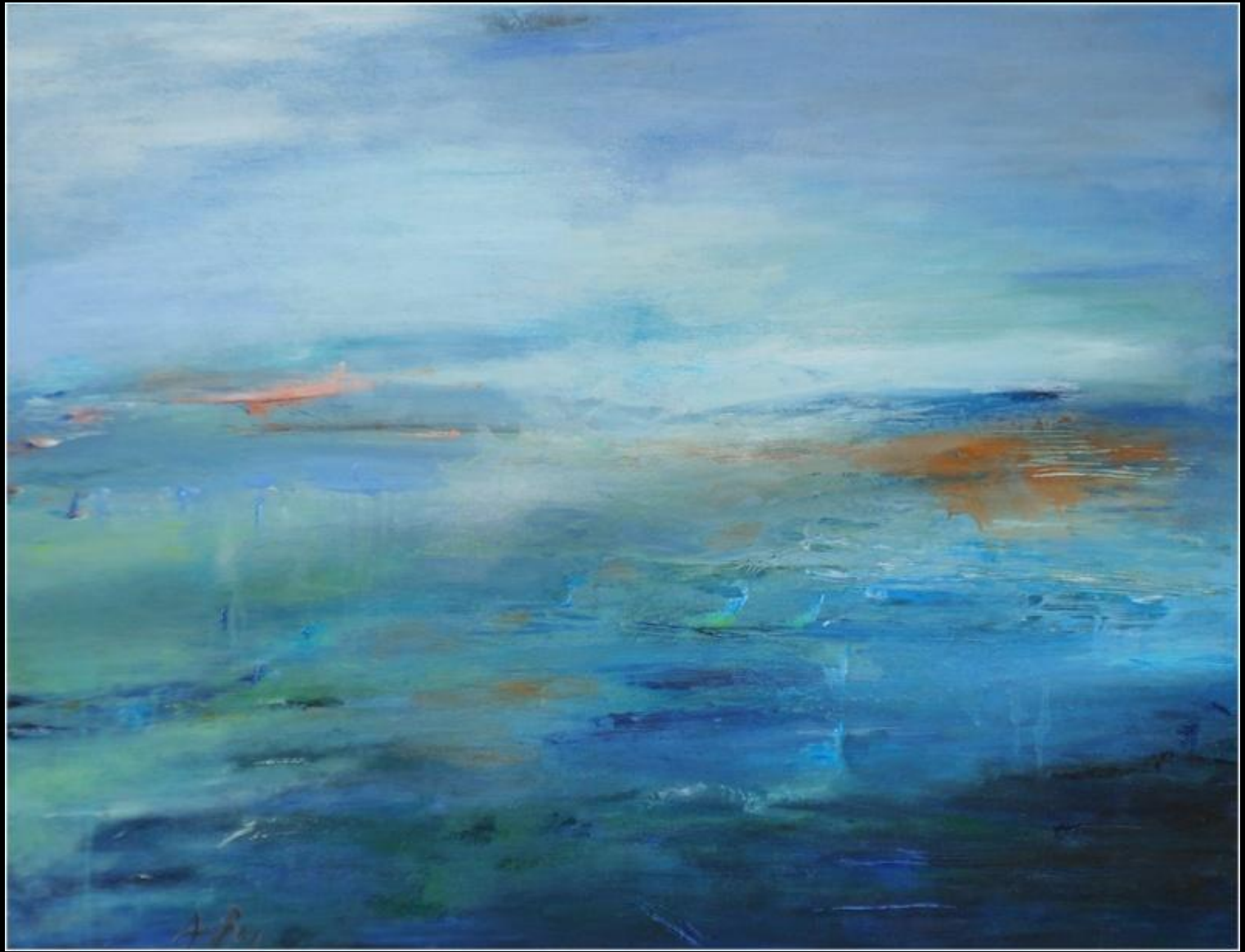
ARUN ROY "Niebla azul"